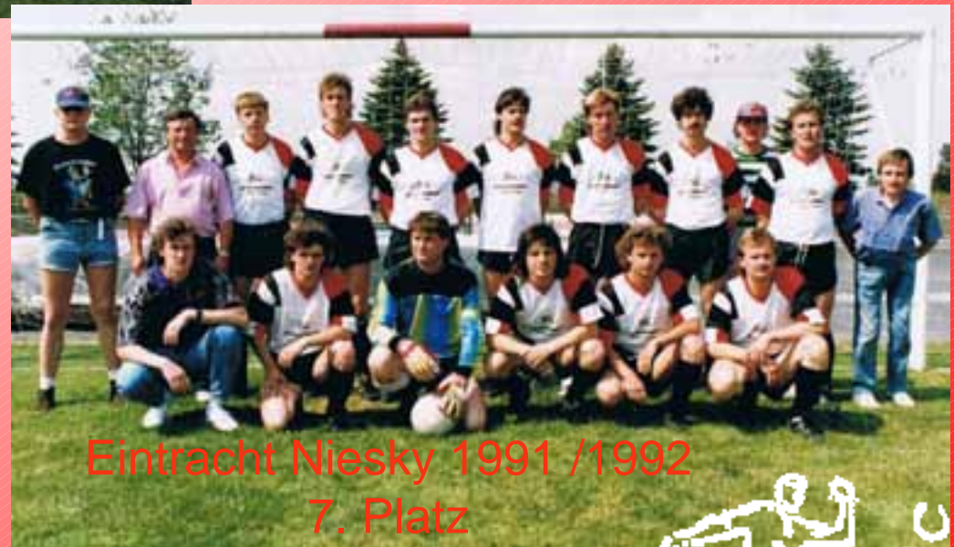
Eintracht Niesky 1991 /1992 7. Platz