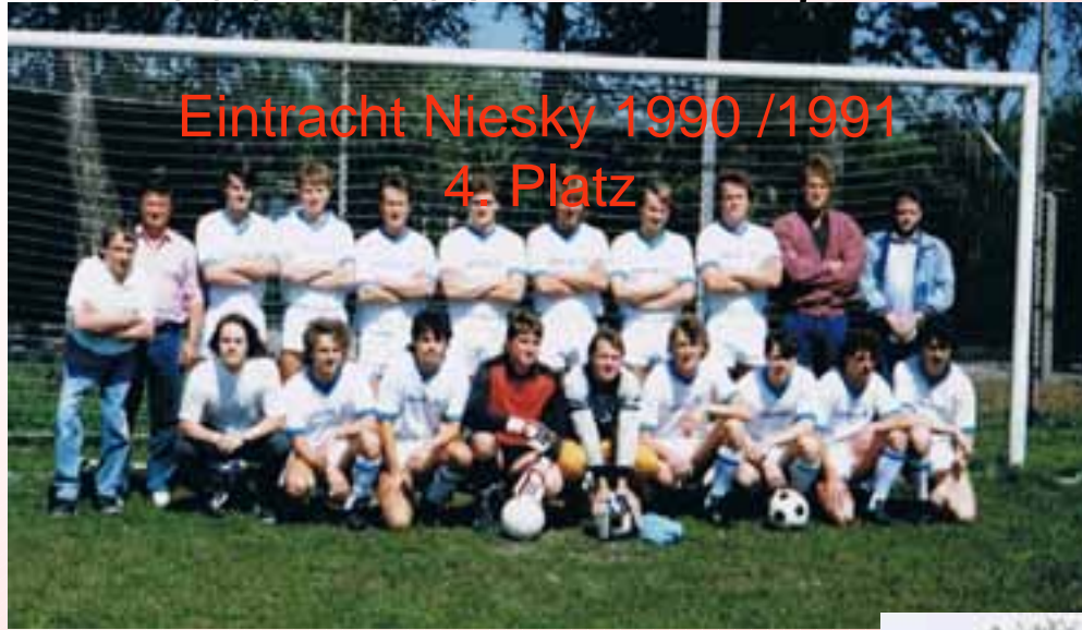
Eintracht Niesky 1990 /1991 4. Platz