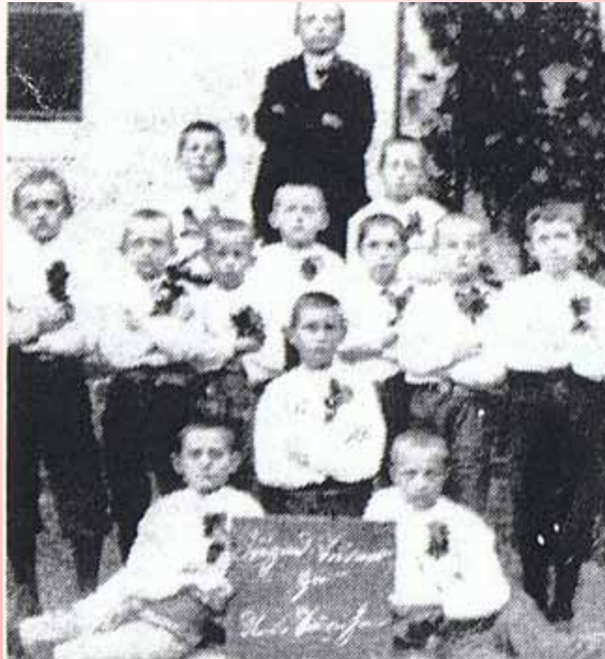
Die Fußballjugendmannschaft des Sportclub Niesky 08 vor einem Turnier im damaligen Ortsteil Neusärichen.