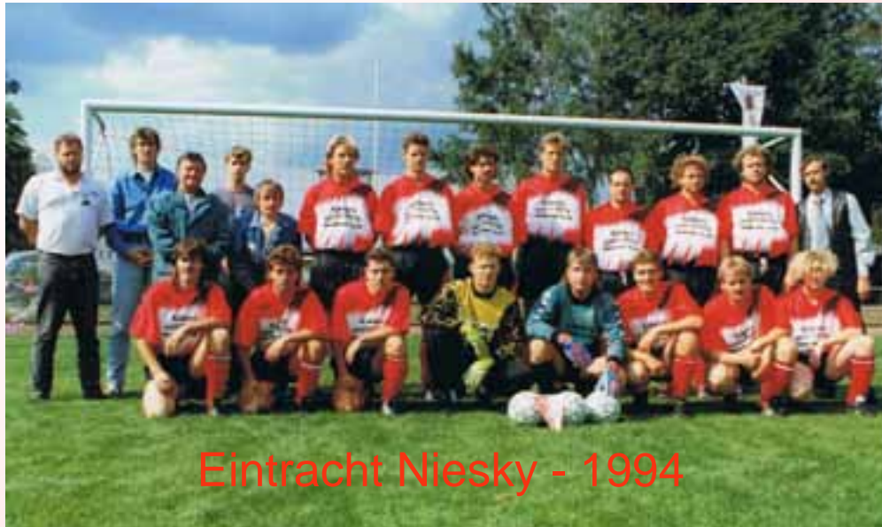
Eintracht Niesky - 1994