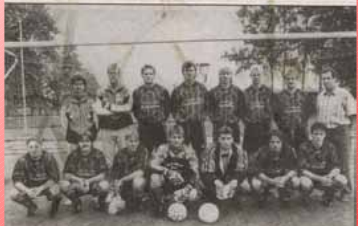
Spielserie 1996/1997 – 4. Platz