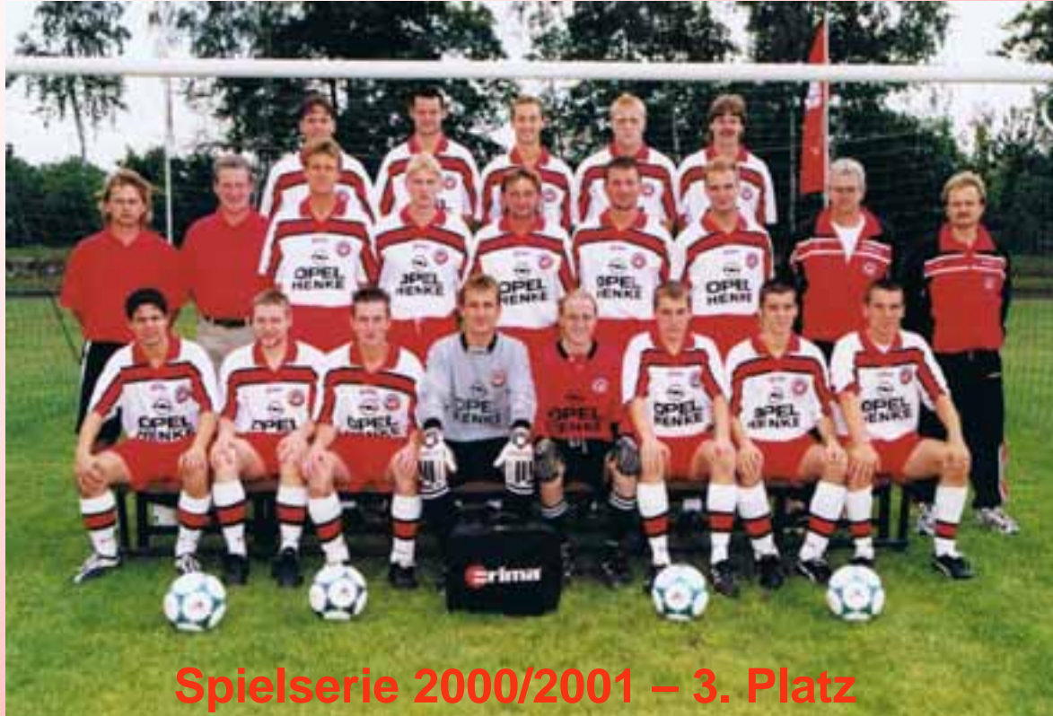
Spielserie 2000/2001 – 3. Platz